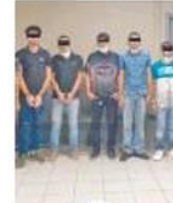
08 GENERAL FRUSTRAN ACCIONES DE GRUPO ARMADO