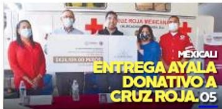
MEXICALI ENTREGA AYALA DONATIVO A CRUZ ROJA. 05

● La disputa de estados clave y la votación por correo debido a la pandemia no garantizan que este día se conozca al ganador de la elección presidencial entre el republicano Donald Trump y el demócrata Joe Biden. 18