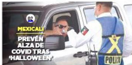
MEXICALI PREVEN ALZA DE COVID TRAS 'HALLOWEEN'